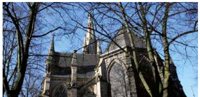
Pfarrerin Schroeder-Nowak ist zurzeit aus gesundheitlichen Gründen nicht im Dienst.